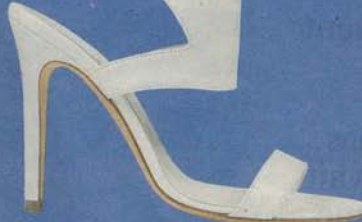
CosmoParis par Delphine Manivet