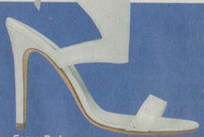
CosmoParis par Delphine Manivet